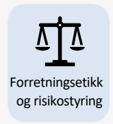
Forretningsetikk og risikostyring